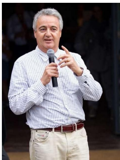
Il giornalista e scrittore Luigi Alfieri di Parma